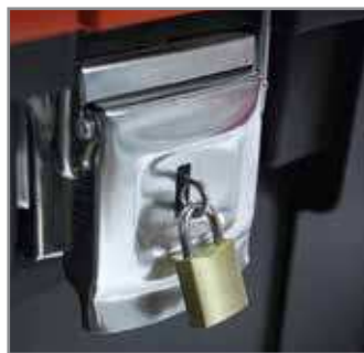
Metal latches - allow for safe transportation of heavy loads. Padlock hole allows you to protect stored tools against theft.

Alu rączka HD- solidny, wydłużony uchwyt umożliwia podniesienie skrzynki dwoma rękami, co ułatwia jej przenoszenie, nawet przy wypełnieniu ciężkimi narzędziami.