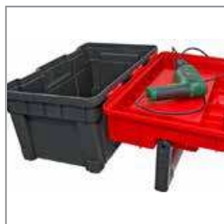
Portable workshop – thanks to a specially made handle, you can transform your box into a mini tool table.

Nóżki - wykonane są z antypoślizgowego elastomeru zwanego adflex. Dolne rogi skrzynki. Chronią dodatkowo jej spód przed pękaniem przy upuszczeniach.