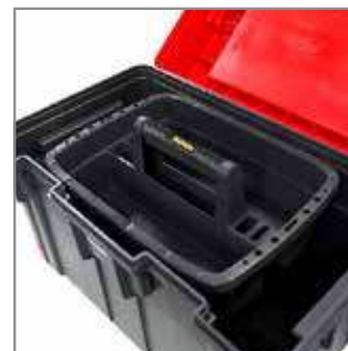
Carriage – it is equipped with holes for smaller elements, such as keys, screwdrivers or measuring tape – in this way, all tools are readily accessible.

Mini warsztat - dzięki specjalnemu uchwytowi, możliwa jest przemiana skrzynki w mini stół narzędziowy.