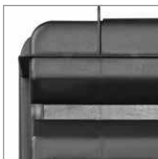
Measure - placed on the cover of ToolBox HD Compact Miarka - wbudowana w pokrywę skrzynki HD Compact