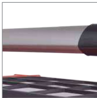
HD Alu handle – solid, elongated handle makes it possible to lift the box with both hands, thus facilitating the transport of your box, even when it is filled with heavy tools.

Alu rączka HD- solidny, wydłużony uchwyt umożliwia podniesienie skrzynki dwoma rękami, co ułatwia jej przenoszenie, nawet przy wypełnieniu ciężkimi narzędziami.