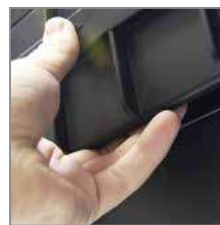
Side handles – help you to carry ToolBox filled with heavy tools.

Metalowe zapięcia – pozwalają na bezpieczny transport ciężkiego ładunku. Uchwyt na kłódkę umożliwia zabezpieczenie magazynowanych narzędzi przed kradzieżą.