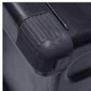
Anti-slip – lower corners of the box are made of anti-slip elasto. They give the bottom added protection against damage in case of accidental dropping.

Kabura Narzędziowa - łatwa w montażu, stanowiąca doskonały dodatek do skrzynki narzędziowej HD. Pozwala na przechowywanie i przenoszenie elektronarzędzi oraz akcesoriów.