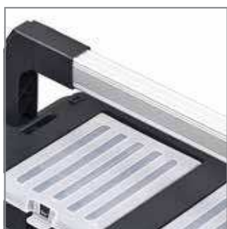
Formula Alu handle. Aluminiowa rączka Formula.