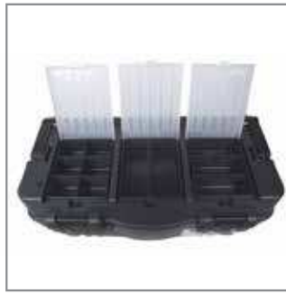
Formula organiser – it allows you to separate small accessories, in this way, you can find the elements you need quickly.

Głęboka jedno- lub dwupoziomowa tacka Plus - duża dwupoziomowa, poręczna tacka z wygodną rączką.