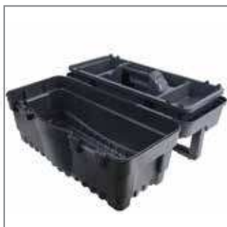
Portable workshop – thanks to specially made handle, you can transform your box into a mini tool table.

Uchwyty boczne - ułatwiają przenoszenie wypełnionej ciężkimi narzędziami skrzynki.