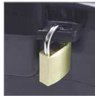
Padlock hole – special padlock hole in the box can be used to protect your tools against theft.

Organizer Formula - umożliwia posegregowanie drobnych akcesoriów, dzięki czemu zdecydowanie szybciej można odszukać potrzebne elementy.