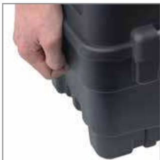
Side handles – help you to carry ToolBox filled with heavy tools.

Miejsce na kłódkę specjalnie wykonany otwór w skrzynce, umożliwia zabezpieczenie magazynowanych narzędzi przed kradzieżą.