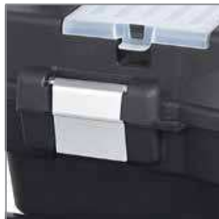
Alu latches – made of anodized aluminium.

Mini warsztat - dzięki specjalnie wykonanemu uchwyty, możliwa jest przemiana skrzynki w mini stół narzędziowy.