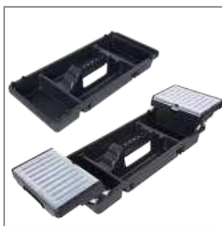
Deep tray or tray Plus – large, two level handy tray with a comfortable handle.

Głęboka jedno- lub dwupoziomowa tacka Plus - duża dwupoziomowa, poręczna tacka z wygodną rączką.